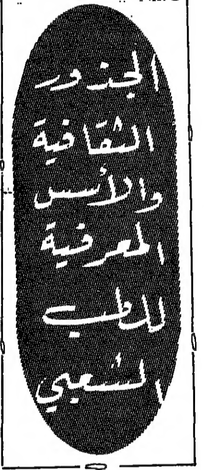
بقلم : نمر سرحان - عمان

الاول : رجل « او امرأة » يدعى الواحد منهما انه بنينا بالغب ويصرف العلاج الصحيح للمرضى ، من زواره لانه تزوج من شخص من الجان . الثاني : ذلك الطبيب الشعبي الذي يدعي ان القدرة السحرية هو المنيذيت قد جابهته لانه واحد من اتباع الطريقة الصوفية او انه ابن لواحد من اتباع تلك الطريقة . وهذا الرجل يستند الى الفكرة القائلة بان نصوص الدين فيها شعاء للناس . الثالث : ذلك الطبيب الشعبي الذي يستند معلوماته من الكتاب - اي بفتح الكتاب ويعطي التفسير او العلاج ، هذا